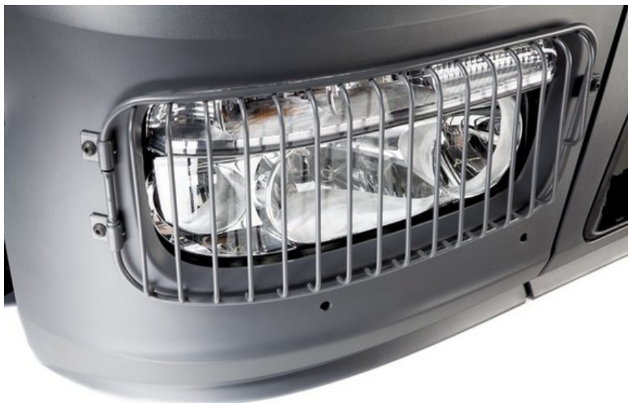
MB Atego (WDB97x; WDB967)